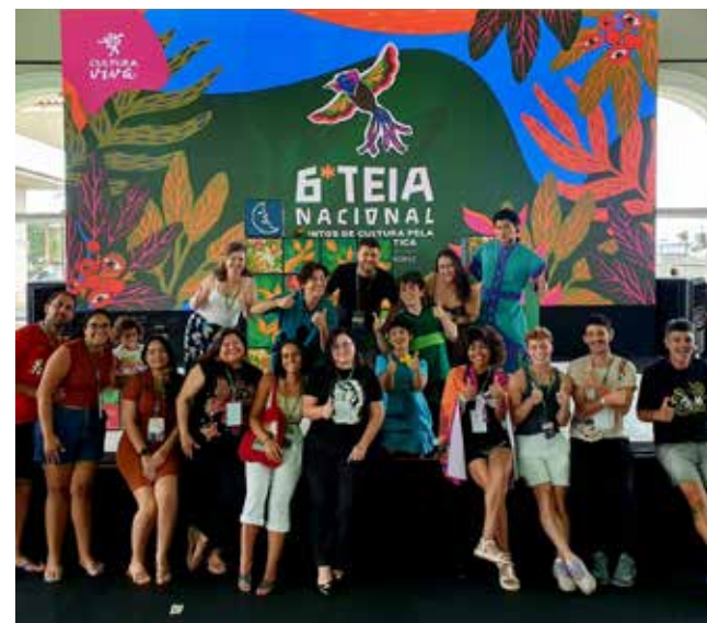
Tistu em Aracruz, ES