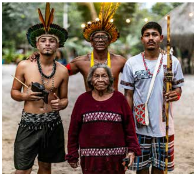
Territórios Teia, Etnoturismo na Aldeia Tekoa Mirim