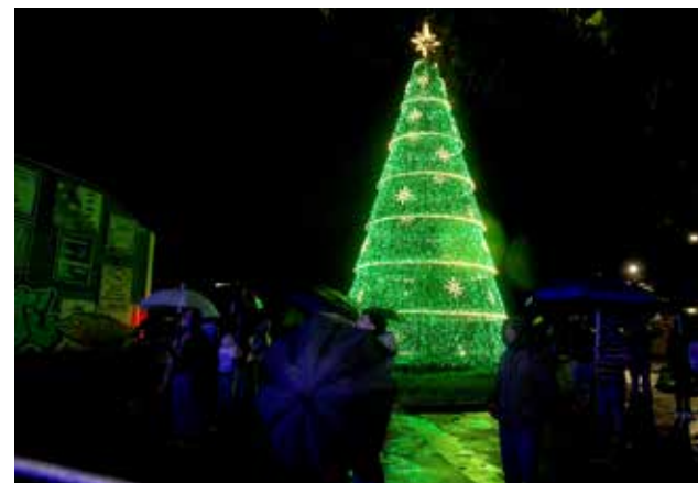
Árvore de Natal da Bley

Curitiba e o Centro Cultural Boqueirão. A parceria entre artistas, poder público e agentes culturais foi um dos pilares da programação.