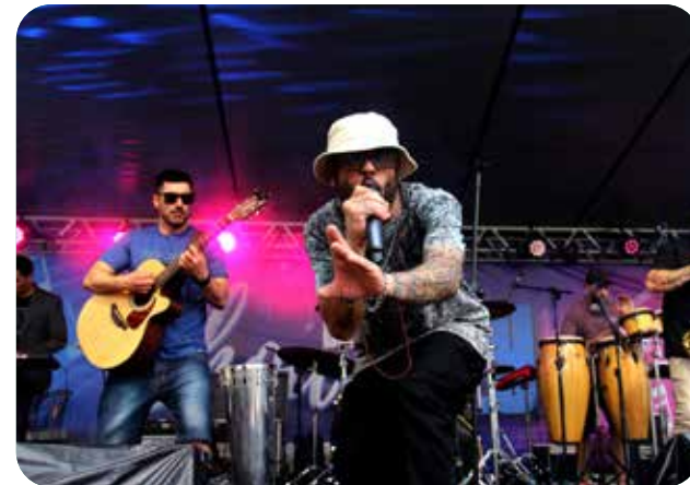
Banda Malsk