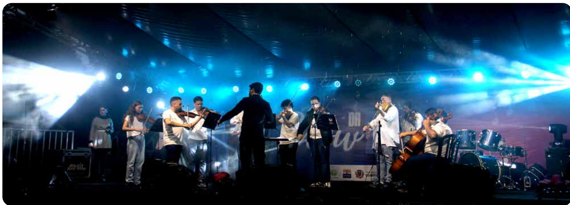
Orquestra de Cordas do Iguaçu