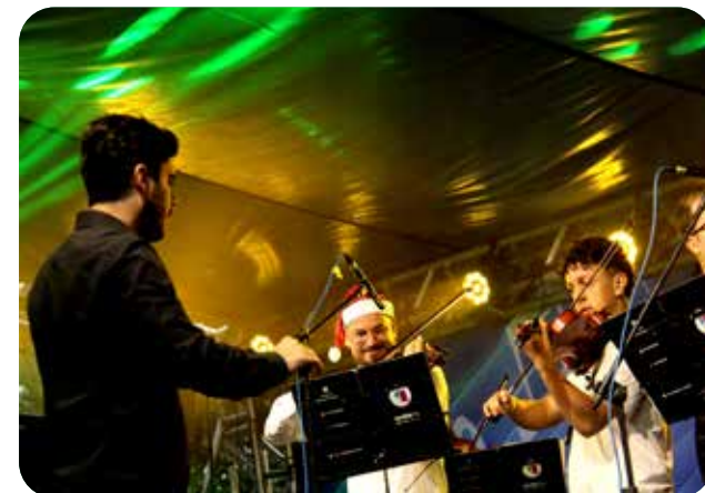
Orquestra de Cordas do Iguaçu