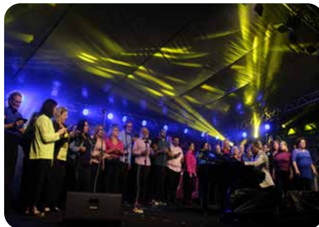
Madrigal Cantate Domino