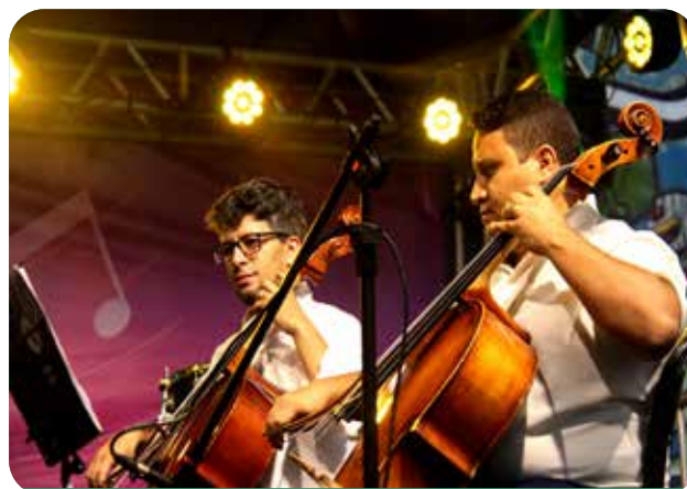
Orquestra de Cordas do Iguaçu