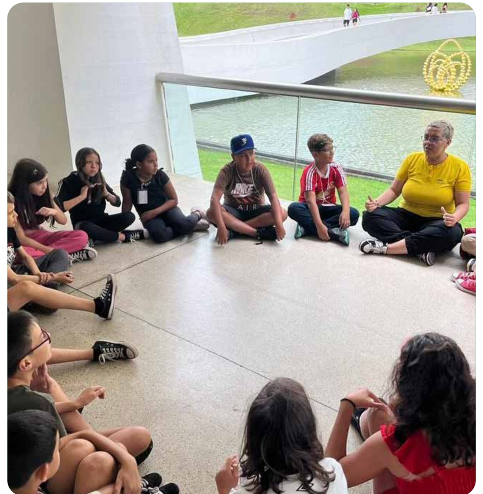
Colônia de férias CCB 2025

contemporânea despertou curiosidade e novas percepções, mostrando às crianças a diversidade e a individualidade dos processos criativos. Além das ações culturais, a colônia contou com momentos de pura diversão. O Unipark garantiu um dia de brincadeiras, desafios e muitas risadas, enquanto o passeio ao parque aquático proporcionou integração, sol e diversão entre amigos. O encerramento aconteceu de forma especial, com um almoço coletivo que celebrou dias de aprendizado, novas amizades e experiências marcantes. Com o sucesso da edição, o Centro Cultural Boqueirão já anuncia que as inscrições para a Colônia de Férias 2026 serão abertas em breve.