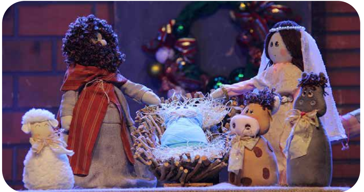
Rádio de Natal

Após o EnCena, a atuação conjunta seguiu intensa. O Centro Cultural Boqueirão manteve uma programação ativa com novas oficinas, como a de criação de roteiro audiovisual para iniciantes, além de apresentações especiais durante a