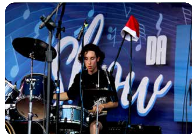
Banda Altitab