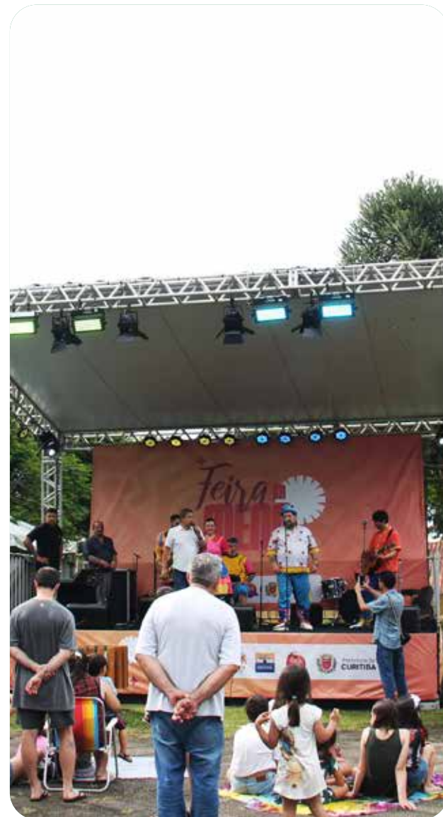
Feira da Menô - Foto Claudia Zanca

A formação artística teve papel central em 2025. O Centro Cultural ofereceu aulas regulares de teatro e balé, com grande procura e participação contínua da comunidade, fortalecendo o vínculo do público com o espaço. O cinema também ganhou destaque por meio do Cine Clube do Centro Cultural Boqueirão, com sessões especiais como a exibição do clássico Jesus de Nazaré, de Franco Zeffirelli, na Sexta-feira Santa, além da Mostra Charles Chaplin, dedicada aos